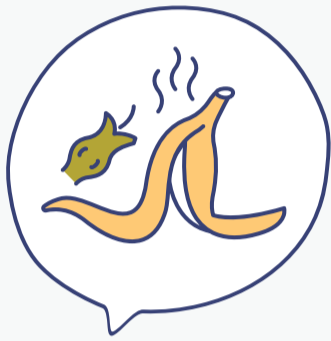
ΦΡΟΥΤΑ & ΛΑΧΑΝΙΚΑ