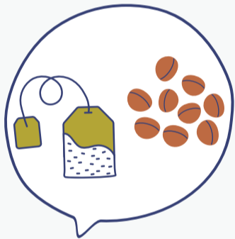
ΥΠΟΛΕΙΜΜΑΤΑ ΚΑΦΕ & ΤΣΑΙ