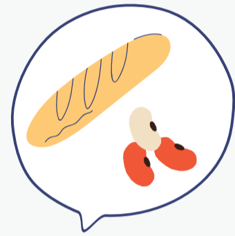
ΨΩΜΙ, ΖΥΜΑΡΙΚΑ, ΡΥΖΙ & ΟΣΠΡΙΑ