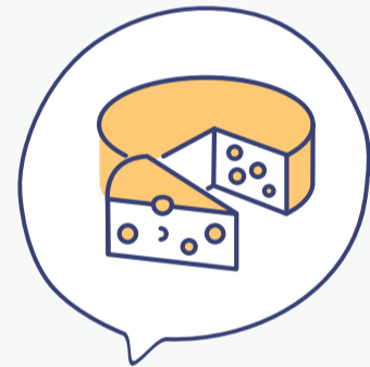
ΓΑΛΑΚΤΟΚΟΜΙΚΑ ΟΠΩΣ ΤΥΡΙ, ΚΡΕΜΕΣ & ΓΙΑΟΥΡΤΙ