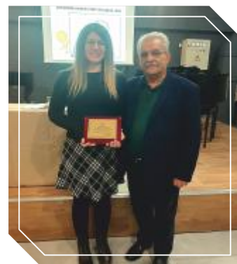
Την Παγκόσμια Ημέρα της Γυναίκας τίμησε ο Δήμος Αγίας Βαρβάρας