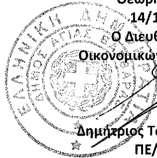
Δημήτριος Τσατσαμπάς ΠΕ/Α