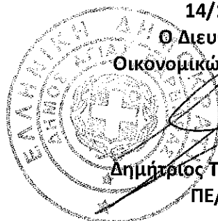
Δημήτριος Τσατσαμπάς ΠΕ/Α