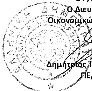
Δημήτριος Τσατσαμπάς ΠΕ/Α