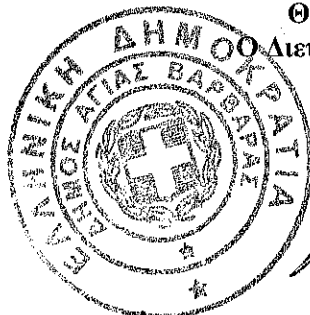
Σαρρή Αντωνία Πολιτικός Μηχανικός Τ.Ε.